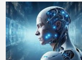
Digitale und analytische Fähigkeiten