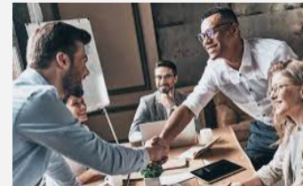
Verhandlungs- führung & Kaufm. Verständnis